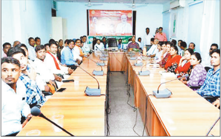
कृषि केन्द्र में सम्मान निधि के लाभार्थी किसानों की मौजूदगी में किस्त का वितरण।

प्रधानमंत्री नरेंद्र मोदी द्वारा आज अपने संसदीय क्षेत्र वाराणसी के कार्यक्रम में शामिल होकर पीएम किसान सम्मान निधि योजना के 17वीं किस्त देश के 9.26 करोड़ किसानों के खातों में लगभग 20 हजार करोड़ रुपए की राशि डीबीटी के माध्यम से हस्तांतरण किए। जिसमें रायगढ़ जिले के कुल 85 हजार 612 किसानों के खाते में 17 करोड़ 31 लाख की राशि डीबीटी के माध्यम से जारी हुआ। रायगढ़ में जिला स्तरीय कार्यक्रम कृषि विज्ञान केन्द्र रायगढ़ में आयोजित किया गया। कार्यक्रम में जिले के विभिन्न गांवों से आये लाभार्थी किसान वर्चुअल कार्यक्रम में सम्मिलित हुए। प्रधानमंत्री नरेंद्र मोदी ने जनसभा को संबोधित करते हुए कहा कि हमें मोटे अनाज, औषधि गुण वाले एवं प्रकृति खेती की ओर बढ़ना होगा। आज पीएम किसान समृद्धि केंद्रों के माध्यम से किसानों के लिए एक बड़ा सपोर्ट सिस्टम विकसित किया जा रहा है। उन्होंने कहा कि माता बहनों के बिना खेती की कल्पना संभव नहीं है। जिसके लिए माता