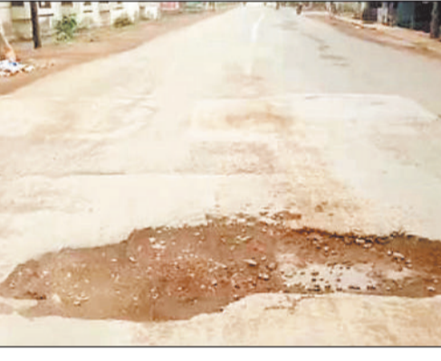
अतिथियों का स्वागत यही से प्रारंभ होता है। गाजेबाजे एवं आतिशबाजी के साथ अतिथियों का फूल मालाओं से स्वागत किया जाता है। लेकिन इसी स्थल के पास सड़क पर गड्ढे को कोई भी जिम्मेदार इसके मरम्मत के लिए आगे नहीं आते। विगत दिनों सांसद महोदय का सरिया आगमन हुआ यह सब जानते हुए भी जिम्मेदार अधिकारी सड़क के गड्ढे को काटने में रुचि नहीं दिखाई बद्दहाल सड़क से होकर सांसद महोदय को आना पड़ा बद्दहाल सड़क के कारण हमेशा भय बना रहता है। विदित हो कि चंद्रपुर मार्ग

नगर पंचायत कार्यालय के सामने महात्मा गांधी चौक के पास सड़क पर गड्ढे को समय पर नहीं भरा जा रहा है। जिससे उसका आकार बढ़ता जा रहा है और वह बदहाल होती जा रही है। जिससे इन पर गुजरने वाले राहगीर परेशान हैं। जबकि जिम्मेदार अफसर इनकी मरम्मत पर ध्यान नहीं दे रहे हैं। परिणाम स्वरूप लोगों की समस्या का समाधान नहीं हो रहा है। नगर पंचायत सरिया के मुख्य अधिकारी तथा गांधी चौक व नगर पंचायत कार्यालय के सामने लंबे समय से यहां सड़क पर गड्ढा बना हुआ है। जिसके कारण आए दिन दुर्घटना हो रही है।